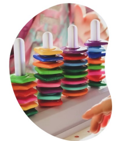
Charta zum Wissenstransfer in der Frühen Kindheit